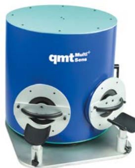
qmtmultisens pour le contrôle optique combiné avec l'acoustique

qmt réalise des solutions sur mesure basées sur le cahier des charges du client. Les systèmes réalisés contrôlent la qualité des produits manufacturés afin de garantir qu'ils sont – dans leur totalité – conformes aux exigences de sécurité et de satisfaction des clients . De plus, qmt a introduit l'inspection mécatronique multiple afin de repousser les limites de la mesure, en combinant le contrôle et l'inspection multi-sigmaux (par exemple optique ou acoustique avec le qmtmultisens) avec d'autres opérations de fabrication.